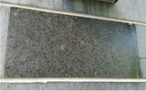
sileä, musta kivilaatta